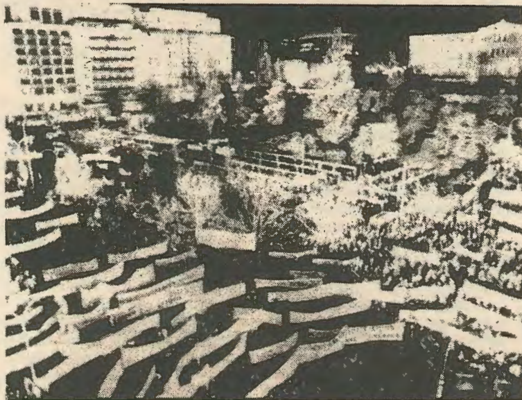
Απο το πρόσφατο συλλαλητήριο στην Αθήνα ενάντια στις Αμερικανικές βάσεις.

τις δυνάμεις ν' απαλλαχτεί από την παρουσία του Παπανδρέου στην Κυβέρνηση. Η δεξιά δεν είναι σε θέση να προσφέρει οτιδήποτε και η αποσύνθεση της Νέας Δημοκρατίας κάμνει απίθανη την εκλογική της επιτυχία στο τέλος της τετραετίας. Είναι φυσικό πολλοί να ονειρεύονται μια στρατιωτική ανατροπή, μια νέα εφταετία.